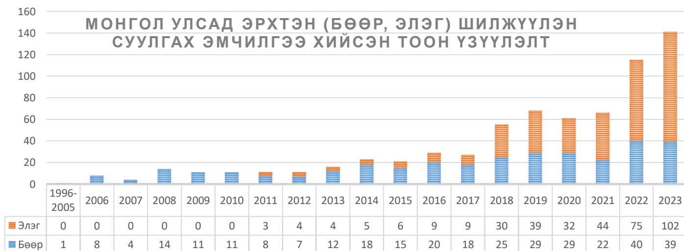
Хүснэгт 2. Монгол улсын хэмжээнд эрхтэн шилжүүлэн суулгах эмчилгээ хийсэн тоон үзүүлэлт

Манай улсын хэмжээнд бөөр болон элэг, нүдний эвэрлэг, зүрх, нойр булчирхай шилжүүлэн суулгах эмчилгээ шаардлага олон зуун иргэн байгаа бөгөөд одоогоор бөөр шилжүүлэн суулгах эмчилгээний хүлээх жагсаалтад 350, элэг шилжүүлэн суулгах хүлээх жагсаалтад 250 гаруй иргэн бүртгэлтэй байгаа болно. Энэ тоо нэмэгдэх хандлагатай байна.