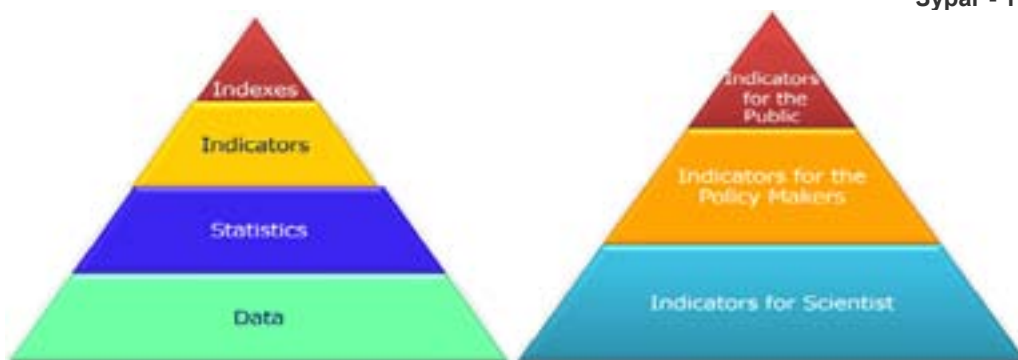
Зураг - 1

Хотын хөгжлийн үзүүлэлтүүдийг дараахь байдлаар бүлэглэдэг. Үүнд: