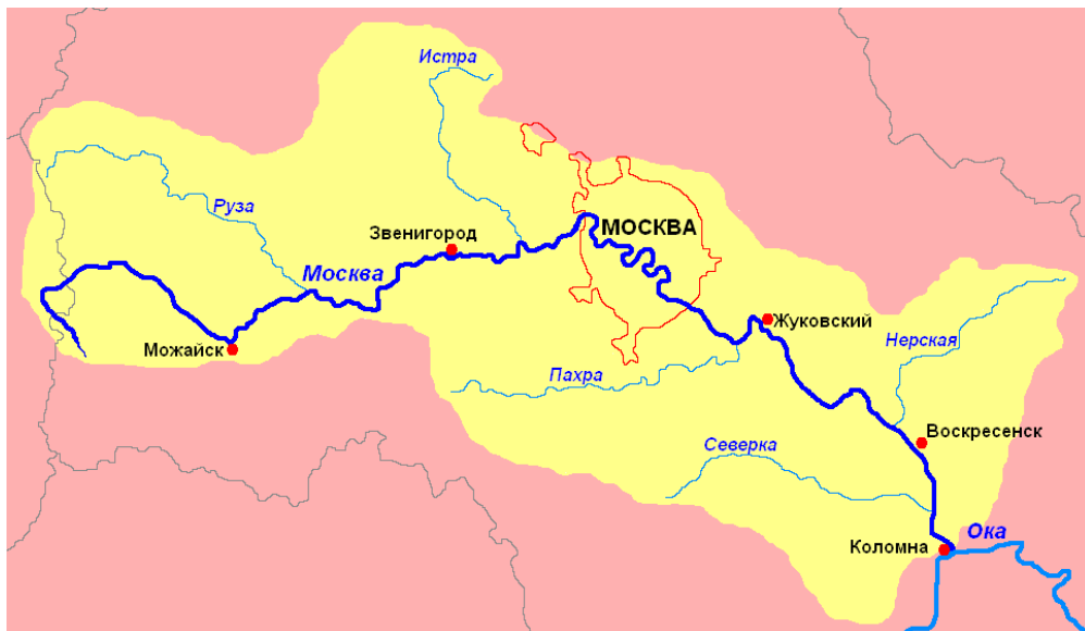
Дүрс 1. Москва голын сав газар (цайвар хэсэг)

ОХУ –ын нийслэлийн эл регион 10 сая давсан хүн амтай, олон салбар чиглэлийн үйлдвэрлэл хүчирхэг хөгжсөн, орон сууц - албан байгууллагын барилга байшингийн нягтшил ихтэй ... тийм ч учраас, их хотын ус суваг, усан хангамжийн асуудал төрийн ба нутгийн удирдлагын түвшиндээ, ялангуяа Москвагийн дум, Москвагийн Засгийн газрын анхаарлын төвд байнга байдаг.