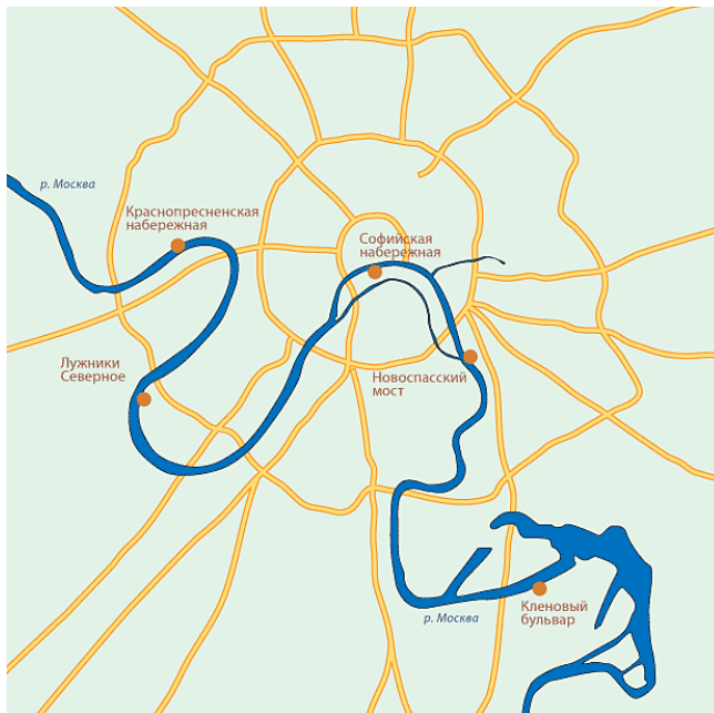
Дүрс 1. Москва хот орчмын Москва-река