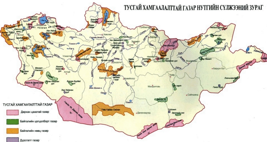
Зураг 1. Тусгай хамгаалалттай газар нутгийн сүлжээ

Эрдэмтдийн судалгаагаар манай орны өндөр уулын экосистемийн 13.7 хувь, ойт хээрийн экосистемийн 6.0 хувь, тал хээрийн 6.0 хувь, цөлийн экосистемийн 23.5 хувь, мөн ховордсон, устгах аюулд ороод байгаа амьтан, ургамлын тархац нутгийн 40 орчим хувь улсын тусгай хамгаалалтад хамрагдсан байна.