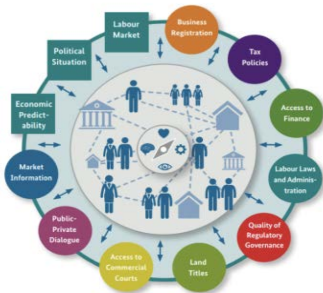
Зураг 3. Аж ахуйн нэгжийн экосистемийн зураглал