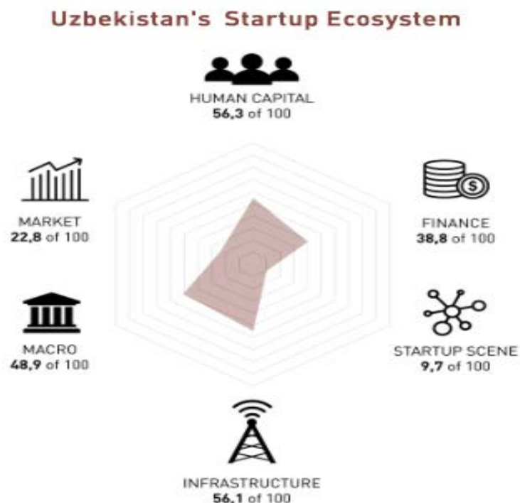
Зураг 2. Узбекистаны Гарааны бизнесийн экосистем