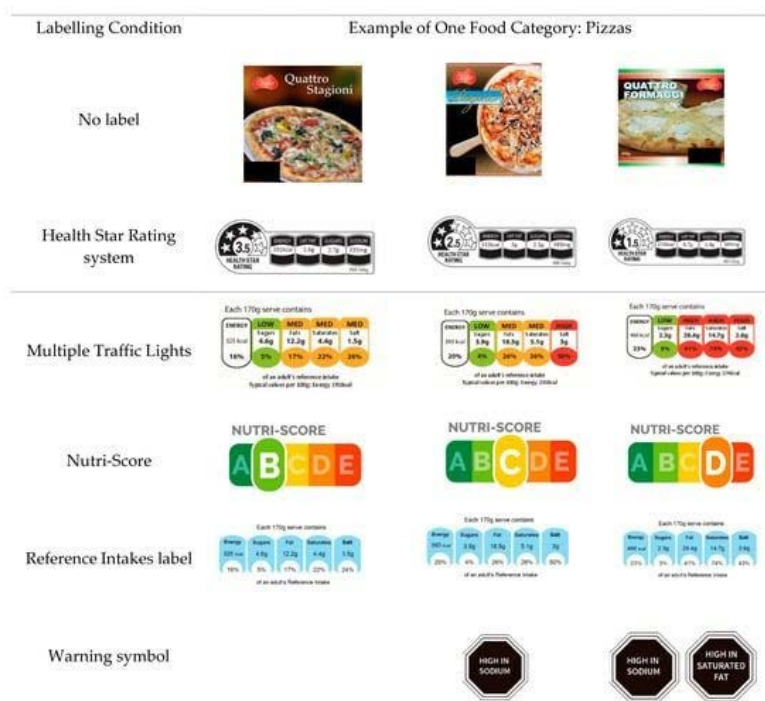
Зураг 2. Европын холбооны хүнсний бүтээгдэхүүний шошгын төрөл, стандарт