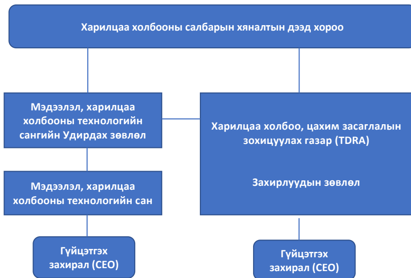
Схем 1. МХХТСангийн удирдлага, зохион байгуулалт

Гүйцэтгэх удирдлага: Тус сангийн өдөр тутмын удирдлагыг Удирдах зөвлөлийн бодлого, чиглэлийн хүрээнд Гүйцэтгэх захирал хэрэгжүүлдэг байна.