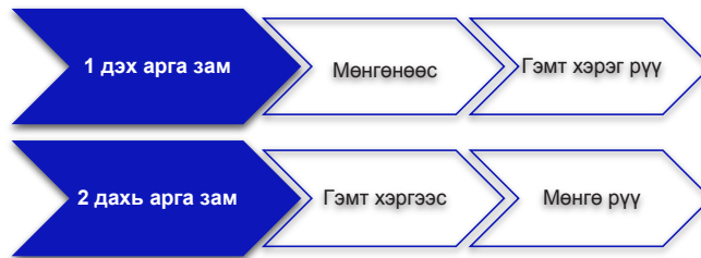
Зураг 2. Мөнгө угаах гэмт хэргийг мөрдөн шалгах арга замууд

Санхүүгийн мөрдөн байцаах үйл ажиллагаа нь дараах байдлаар явагдана: