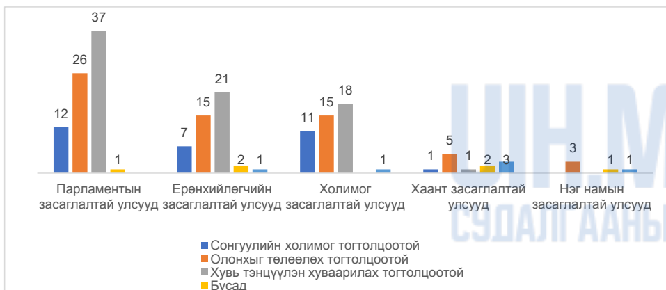
Зураг 3. Дэлхийн улс орнуудын парламентын сонгуулийн тогтолцоо