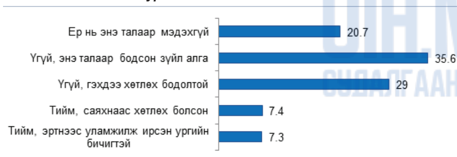
Зураг 2. Угийн бичиг хөтлөлт

Засгийн газрын тогтоолоор баталсан Угийн бичиг хөтлөх журам нь овог хэрэглэх, угийн бичиг хөтлөх, угийн зураглал хөтлөх, угийн бичиг баяжуулах, өвлүүлэх, хэрэглэх тухай зохицуулсан таван бүлэг бүхий зохицуулалттай байна. Монгол Улсын Засгийн газрын 2007 оны 10 дугаар сарын 3-ны өдрийн 257 дугаар тогтоолоор “Угийн бичиг хөтлөх журам”-ыг 312 шинэчлэн баталж гэр бүл бүрт угийн бичиг хөтлөх дэвтэр тараасан нь бүх нийтийг хамарч чадаагүй байна. Учир нь Философи, социологи, эрхийн хүрээлэнгээс гаргасан “Монгол гэр бүлийн харилцааны өнөөгийн байдал” сэдэвт социологийн судалгаанд тус журмын хэрэгжилтийн байдлыг анкетын санал асуулгын аргаар гаргасан байна. Уг судалгаанд оролцогчдын дөнгөж 7.3 хувь нь эртнээс уламжилж ирсэн угийн бичигтэй гэсэн бол 7.4 хувь нь саяхнаас хөтлөх болсон гэсэн нь энэ талаар төрөөс хэрэгжүүлсэн бодлого нийтийг хамарсан ажил болж чадаагүй, харин угийн бичиг хөтлөх нь зүйтэй гэсэн цочроо өгснөөс (хөтлөх бодолтой байгаа гэж 29.0 хувь нь хариулсан) хэтрээгүй ажил болсон байна гэж журмын хэрэгжилтийг дүгнэжээ. 313