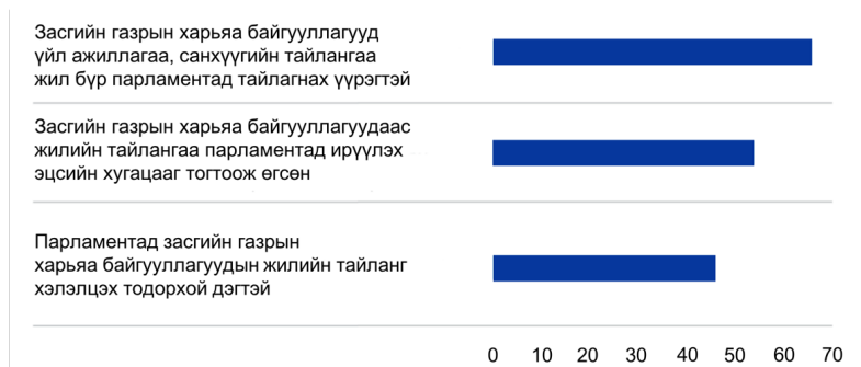
Зураг 1. Засгийн газрын харьяа байгууллагуудаас парламентад жилийн тайлангаа хүргүүлдэг байдал

Эх сурвалж: IPU/UNDP Questionnaire for Parliaments, 2016. (Асуулгад парламентын 203 танхим оролцсон)