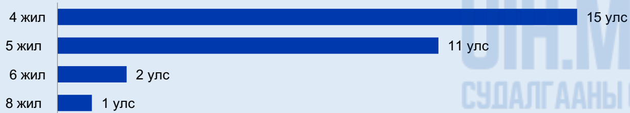
Зураг 2. Спикерийн бүрэн эрхийн хугацаа 1 жил байдаг улсуудын Парламентын танхимын бүрэн эрхийн хугацаа

Спикерийг 2 жилийн хугацаанд сонгодог 6 улсын парламентын 8 танхим байна. Эдгээрээс 5 (63%) танхимын бүрэн эрхийн хугацаа 4 жил, 2 (13%) танхимынх - 5 жил байна. АНУ-ын Төлөөлөгчдийн танхимын бүрэн эрхийн хугацаа нь 2 жил бол Бразилийн Холбооны Сенатынх 8 жил байна. (Зураг 3.)