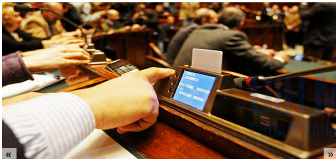
Зураг 2. Италийн Төлөөлөгчдийн танхимын санал хураалтын төхөөрөмж

Eurel Informatica SpA -г 1986 онд Ром хотноо үүсгэн байгуулсан ба өдгөө 31 дэх жилдээ үйл ажиллагаагаа явуулж байна. Тус компани нь төрийн захиргааны байгууллагуудад зориулсан тоног төхөөрөмж үйлдвэрлэж, нийлүүлдэг бөгөөд Италийн Сенат, Төлөөлөгчдийн Танхим, Европын Парламентыг тус тус цахим тоолуурын төхөөрөмжүүдээр хангадаг байна. Eurel Informatica компаний хурууны хээгээр санал өгөх тоног төхөөрөмжийг Италийн Төлөөлөгчдийн танхим, Албанийн парламентад амжилттай нэвтрүүлж, хэрэглэж байна. Тус компани болон бүтээгдэхүүний талаарх дэлгэрэнгүй мэдээллийг дараах хаягаар орж үзнэ үү. http://english.eurel.it/home