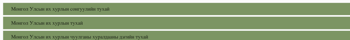
Зураг 1: 2019 оны Үндсэн хуулийн нэмэлт, өөрчлөлтөд холбогдох судалгааны ажлын дашибард, https://cli.num.edu.mn/