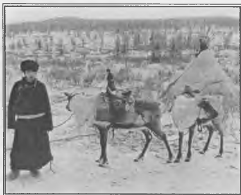
Уналаганд хэрэглэдэг цаа буга

Тайгын багийн засаг даргаас авсан мэдээгээр баруун тайгад 2002 онд нийт 385 цаа буга тоологдсон бол 2003 оны 8-р сард Улаанбаатараас очсон эрдэмтдийн тоолсноор баруун тайгад 512 цаа буга байсан байна. Ер нь цаа бугын жинхэнэ тоог гаргахад бэрхшээлтэй. 1990 онд 1000 цааны баяр тэмдэглэхэд цааны тоо толгой 1000 хүрээгүй байсан гэж мэтгэлцэх хүн ч байдаг. Цааны жинхэнэ тоо толгойг хэлдэггүй нь цаатнуудын сүсэг бишрэлтэй холбоотой ажээ.