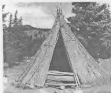
Эртний үед хэрэглэж байсан ури

Цаатан ардууд нь 3-4 метрийн урттай, том ури бол 28-32, жижиг ури бол 17-23 мод орсон, брезентээр бүрсэн уламжлалт сууцандаа цельсийн нэмэх 31 хэмээс цельсийн хасах 53 хэм хүртэлх цаг уурын нөхцөлд өнөөг хүртэл амьдарсаар байна. Өмнө нь ангийн болон цаа бугын арьс, модны холтосоор урцаа бүрдэг байсан бол 1970-аад оноос судалгаа явуулж байж, бүх урцыг брезентээр бүрэх болжээ.