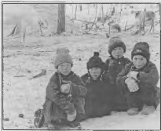
Баруун тайгад амьдардаг цаатан хүүхдүүд

сурагчдын амралтаар цалингүй амрадаг зэрэг хөдөлмөрийн харилцааны зөрчил гардаг нь багш нарын бүтээлч үйл ажиллагаанд сөргөөр нөлөөлдөг байна. /Цагааннуур сумын бага ангийн багш нартай хийсэн ярилцлагаас/ Цагааннуур сумын дунд сургуульд нийтдээ цаатан гаралтай 5 бага ангийн багш ажиллаж байна.