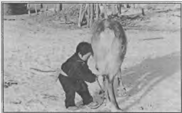
Цаатан хүүхэд, цаа бугын хамт

Одоогийн байдлаар орон нутгаас цаатан ардын аж амьдралыг сайжруулах талаар хийж байгаа дорвитой ажил байхгүй байна. Тэднийг нутгийн бусад иргэдийн адил хэмжээнд авч үздэг болохоос үндэсний цөөнх, устаж үгүй болох гэж байгаа эмзэг талаас нь тодорхойлж гаргасан бодлого шийдвэр байхгүй ажээ. Харин ч олон нийтийн дунд тэднийг залхуу, архичин, бэлэнчлэх сэтгэлгээтэй гэх мэтээр хандах буруу үзэл хандлага түгээмэл байна.