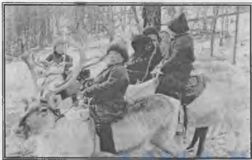
Баруун тайгад амьдардаг цаатан хүүхдүүд

Хөвсгөл аймгийн Цагаан нуур сумын хоёрдугаар багийг бүрдүүлж байгаа цаа маллан тайгад амьдардаг уйгур угсааны тува /Духа/ хүмүүс нь Монгол Улсын үндэстний хамгийн цөөнх болно. Эдгээр хүмүүс нь ОХУ-ын Тувагийн нутаг хуучин Тожийн хүшуу, Тоду, Соён Кыргыз, Ханачи, Маат, Балыкчи, Хуулар овгийн Тува яс угшлын хүмүүс юм. Монголд ойн иргэд цаа буга өсгөн маллаж, хонь малладаг малчидтай зөрчилдөж байдаг тухай Ираны түүхчид 1310 оны үед бичсэн байдаг.