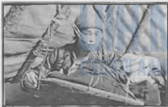
Уламжлалт өлгийдөө хүүхдээ өлгийдсэн байгаа нь

амьдралын хугацаанд давтах үйлүүд болно. Цаатан ардуудын амьдралын хэв хэвшил дотор эртний овгийн байгууллын үеийн улбаа өнөө хэр хадгалагдсаар ирснийг тэдний зан үйлийг судалдаг гадаад дотоодын эрдэмтэд ажиглан мэдээлж байна. Тухайлбал, 2002 онд зүүн тайгын 10 өрхөд хийсэн судалгаагаар тэд хүнсээ /махаа/ ав адилхан хуваан авч, яг нэг өдөр хүнсээ дуусгаж байгаа жишээ болно. Мөн нас барагсдаа оршуулах зан үйлэнд ч их эртний хэв шинж хадгалагдаж байгаа юм. Цаатан ардуудын эд өлөг, хувцас хэрэглэл, гоёл чимэглэл, эдийн соёлын бүхий л өв уламжлал нь өнөөдөр бараг бүрэн устан үгүй болж байна. Тэд орчин үеийн шаардлагаар арьсан гутал, богцноосоо аажим салж байгаа шигээ хэл соёл, зан заншлаа мөн бөхөөн орхиж байна.