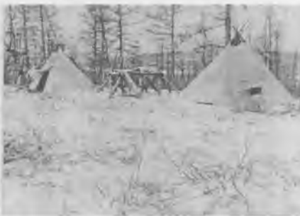
Одоо цагт хэрэглэж буй ури

Цаатан иргэдийн өөрийн соёл иргэншлийн гол онцлог баталгаа нь цаа бугатай салшгүй холбоотой. Гэтэл сүүлийн жилүүдэд цаа буга эрс хорогдсон нь тайгад амьдарч байгаа цаатан иргэдийг талд бууж ирж, өөрсдийн уламжлалт амьдралын, өвөрмөц хэв маягаасаа татгалзахад хвөгэж байна.