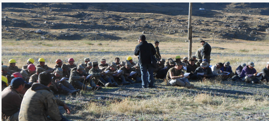
Зураг 2. Замын барилгын ажил гүйцэтгэж буй 340 дүгээр ангийн хугацаат цэргийн албан хаагчид судалгааны асуултад хариулж байгаа нь