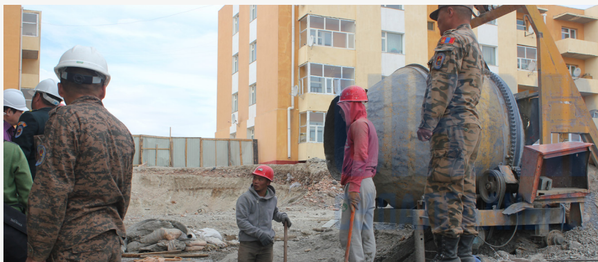
Зураг 1. Барилгын талбайд ажиллаж буй 339 дүгээр ангийн хугацаат цэргийн албан хаагчид, ахлагч нар

340 дүгээр ангийн дийлэнх бие бүрэлдэхүүн Баян-Өлгий аймгийн Ногооннуур сумын нутагт байрлах Асгат гэх газар зам барилгын ажилд оролцохоор томилогдон явсан байв. Өмнөх жил нь хувь хүн, аж ахуйн нэгжтэй гэрээ байгуулан хугацаат цэргийн албан хаагч зэрэг албан хаагчдаар барилга угсралтын ажил гүйцэтгүүлсэн байна. Эдгээрт байшингийн дээврийн цутгалтын ажил, орон сууцны зоорийн давхрын хучилтыг хийх үеийн барилгын туслах ажил, машин дээр тоосго ачих, түүхий тоосго талбайд хураах, бетон зуурмаг зууруулах, зөөвөрлөх, хувийн эмнэлэг, ресторан, сумын хэсгийн төлөөлөгчийн байрны барилгын өргөтгөлийн ажилд туслах ажил гэх мэт болно.