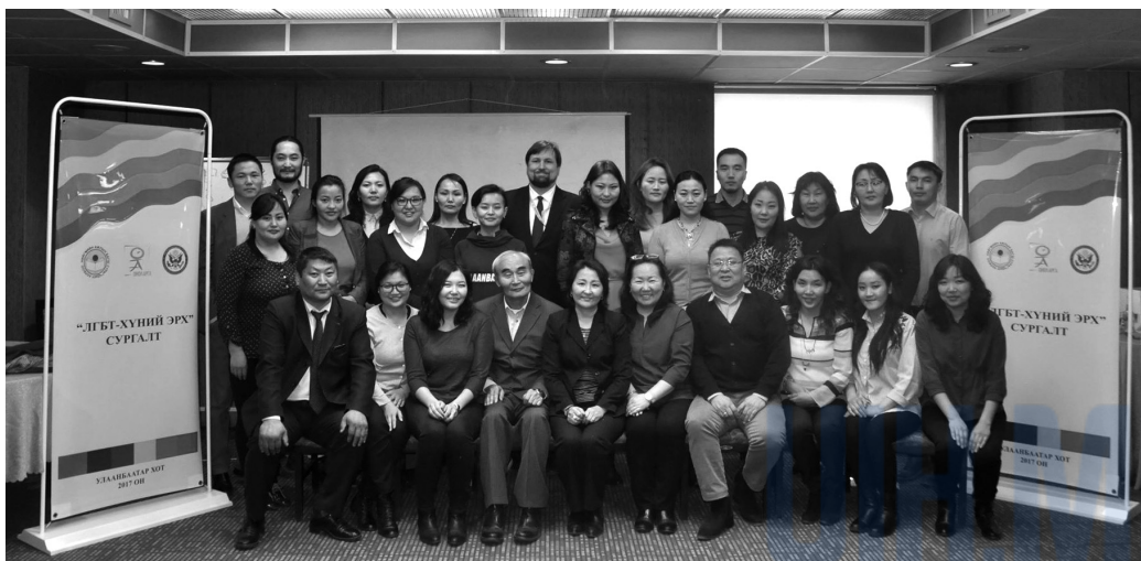
Нийгмийн ажлын багш нар, хөтөлбөрийн албаны мэргэжилтнүүдийг чадавхжуулах сургалт-2017 он