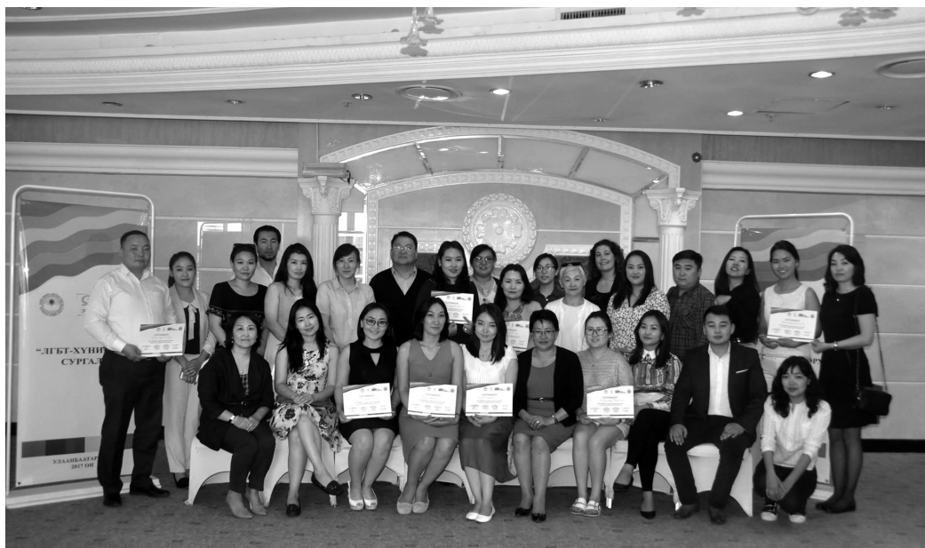
Хүний нөөцийн багш нар, мэргэжилтнүүдийг чадавхжуулах сургалт-2017 он

энэ эрхтэй харилцан хамааралтай оршдог шаардлага хангахуйц амьжиргааны түвшинтэй байх, шаардлага хангахуйц орон байртай байх, нийгэм, соёлын амьдралд оролцох эрхүүд нь шууд зөрчигддөг байна. Түүнчлэн олон нийтийн, соёл, улс төрийн амьдралд оролцох эрхээ эдлэхэд сөрөг нөлөө үзүүлж байна гэсэн үг юм. ( ЛГБТ Төв, Монгол дахь бэлгийн цөөнхийн эрхийн хэрэгжилт, 2013 ).