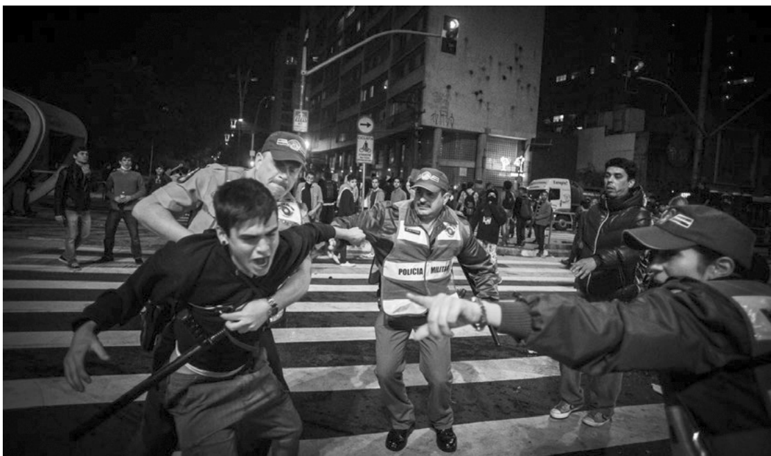
Цагдаа нар эсэргүүцэгчийг саатуулж байгаа нь, Бразилын Сан Паоло хот, 2013 оны 6 сарын 18.

нөхцөл байдлыг авч үзэх, мөн хүч хэтрүүлэн хэрэглэсэн, эсхүл шаардлагагүй үед хүч хэрэглэсэн зэрэг асуудлыг дүгнэхээсээ өмнө ямар арга хэрэгсэл ашигласныг нь үнэлэх хэрэгтэй. Үүний тулд хүч хэрэглэх асуудлыг дотоодын хууль, бодлого болон олон улсын хэм хэмжээнд хэрхэн авч үздэг талаар, мөн энэ тухайд цагдаа ямар бүрэн эрхтэй, хуулиар ямар эрх хэмжээ олгогдсон талаар ойлголттой байх шаардлагатай. 29 Баривчилсан тохиолдолд ч үүнд нэгэн адил хамаарна Дур зоргоороо баривчилсан гэж дүгнэхийн тулд дур зоргоор баривчилна гэдэг нь чухам ямар утгатай, ямар хуульд заасан байдаг, баривчилгааг хуулийн дагуу явуулахын тулд цагдаа ямар дүрэм журам баримтлахыг хуулиар зөвшөөрдөг талаар ойлголттой байх шаардлагатай.