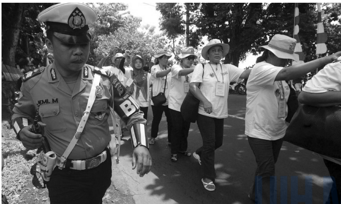
Манадо хотод болсон Далай тэнгисийн асуудлаарх дэлхийн бага хурлын үеэр, хууль бус загасчлал болон далай тэнгисийг бохирдуулахыг эсэргүүцэн уриа лоозон барин жагсаж байгаа байгаль хамгаалагчдыг цагдаа нар хамгаалж байна, Индонез улс, 2009 оны 5 сарын 11.

Хэд хэдэн улс хүний эрх хамгаалагчдыг хамгаалах үндэсний хууль тогтоомжийг баталж, үүндээ НҮБ-ын Хүний эрх хамгаалагчдын тухай тунхаглалаар олон улсын өмнө хүлээсэн үүргээ тусгаж өгсөн байдаг. Энэ нь хүний эрхийг хамгаалагчдын үндэсний хэмжээнд хууль ёсоор ажиллах эрхийг баталгаажуулсан эерэг алхам хэдий ч хууль тогтоомжийг үр дүнтэй хэрэгжүүлж байгаа эсэх, мөн хүний эрх хамгаалагчдын үйл ажиллагаанд хэрхэн нөлөөлж байна вэ гэдэг нь улс орон бүрт харилцан адилгүй байгааг тэмдэглэх хэрэгтэй. 38