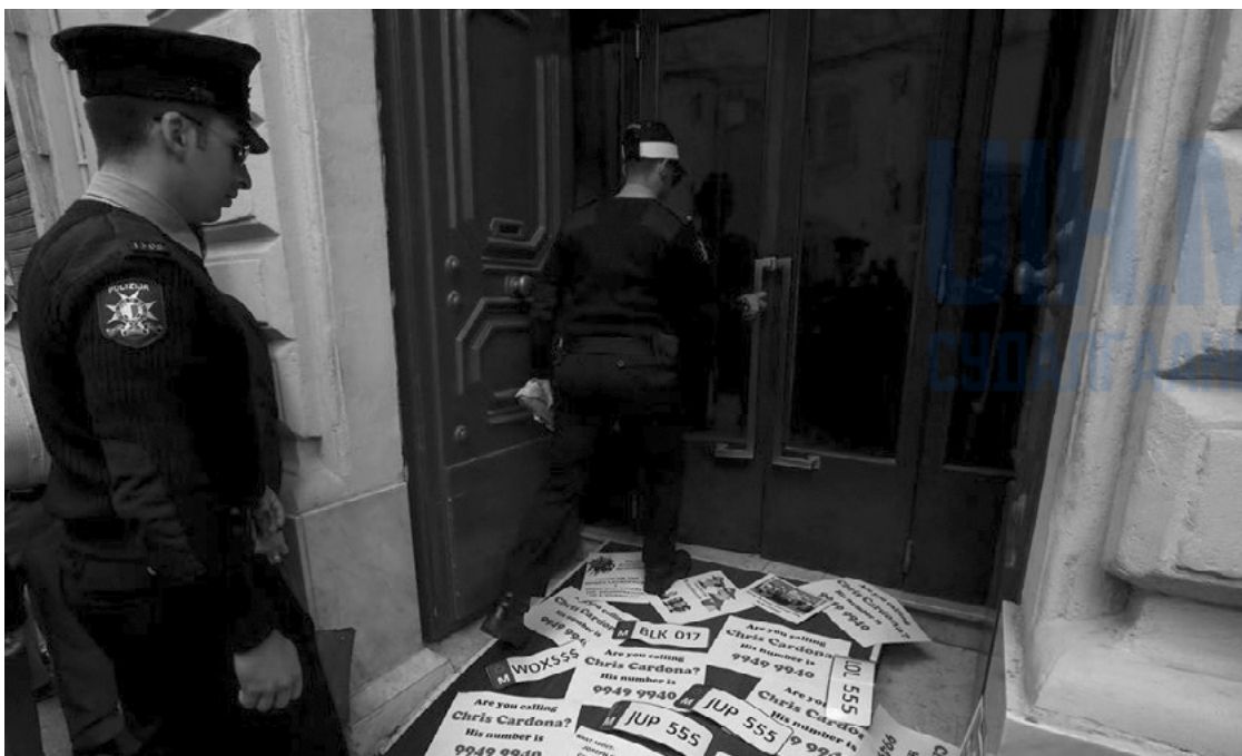
Мальта улсын сангийн сайд Крис Кардонаг авлигын эсрэг бичдэг сэтгүүлч Дафни Каруана Гализигийн аллагад буруутгагдсан хүмүүсийн нэгэнтэй нь уулзсан хэмээн Дафни Санаачилга төслийн хэсэг сэтгүүлчид мэдээлсний дараа иргэний нийгмийн идэвхтнүүд түүнийг байцаахыг цагдаагаас шаардаж, Валетта (Мальта) хотын цагдаагийн газарт орхисон зурагт хуудсан дээгүүр цагдаагийн ажилтнууд алхаж байна, 2018 оны 4 сарын 19