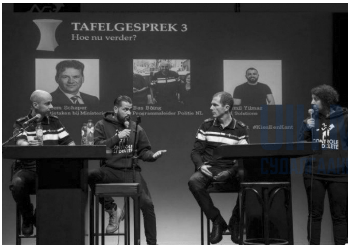
Голланд улс дахь үндэсний цөөнхийг зогсоож шалгадаг явдлыг зогсоохын тулд байгуулагдсан Ctrl Alt Delete хөдөлгөөний гишүүд цагдаа нартай Ctrl Alt Delete #5 арга хэмжээний үеэр ярилцаж байгаа нь, Амстердам Мэлвиг, Голланд улс, 2017 оны 12 сарын 11.

Хэрвээ цагдаа нартай ерөнхийдөө тааруу харилцаатай бол дайсагнасан хандлагатайгаар яриа хэлэлцээрт орох нь зөвхөн эсрэг үр дүнг л авчирна. Хүний эрхийг хамгаалагчид үйл ажиллагаа явуулахдаа цагдаад үргэлж хохирогчдын зөв байдаг, эсхүл хохирогчдод үргэлж цагдаагийн буруу байдаг гэсэн ойлголт төрүүлэхээс зайлсхийх хэрэгтэй. Үүний оронд, цагдаатай харилцахдаа, тэдний үзэл бодол болон тэдний ажилд тулгардаг сорилтуудыг ойлгоход бэлэн байгаа гэдгээ харуулах нь үр дүнтэй яриа хэлэлцээр хийх магадлалыг нэмэгдүүлнэ.