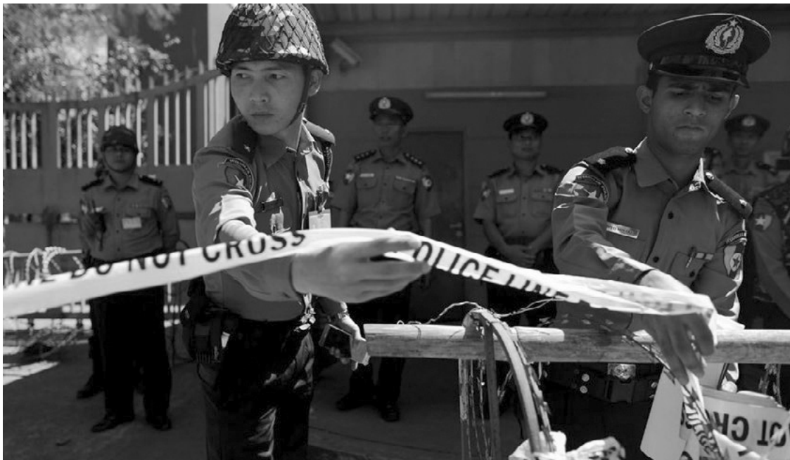
Мьянмар улсын Янгон хот дахь Тайландын элчин сайдын яамны өмнө Буддын лам нар, хүний эрхийн төлөө тэмцэгчид Тайландын засгийн газраас хуучин хамба ламыг нь баривчлахын тулд Дхамакаяа сүмд нэгжлэг хийх зөвшөөрөл өгсөн тусгайлсан хууль гаргахаар уриалж байгааг эсэргүүцсэн жагсаалыг цагдаа нар зохицуулж байгаа нь, 2017 оны 2 сарын 24, © REUTERS/Soe Zeya Tun