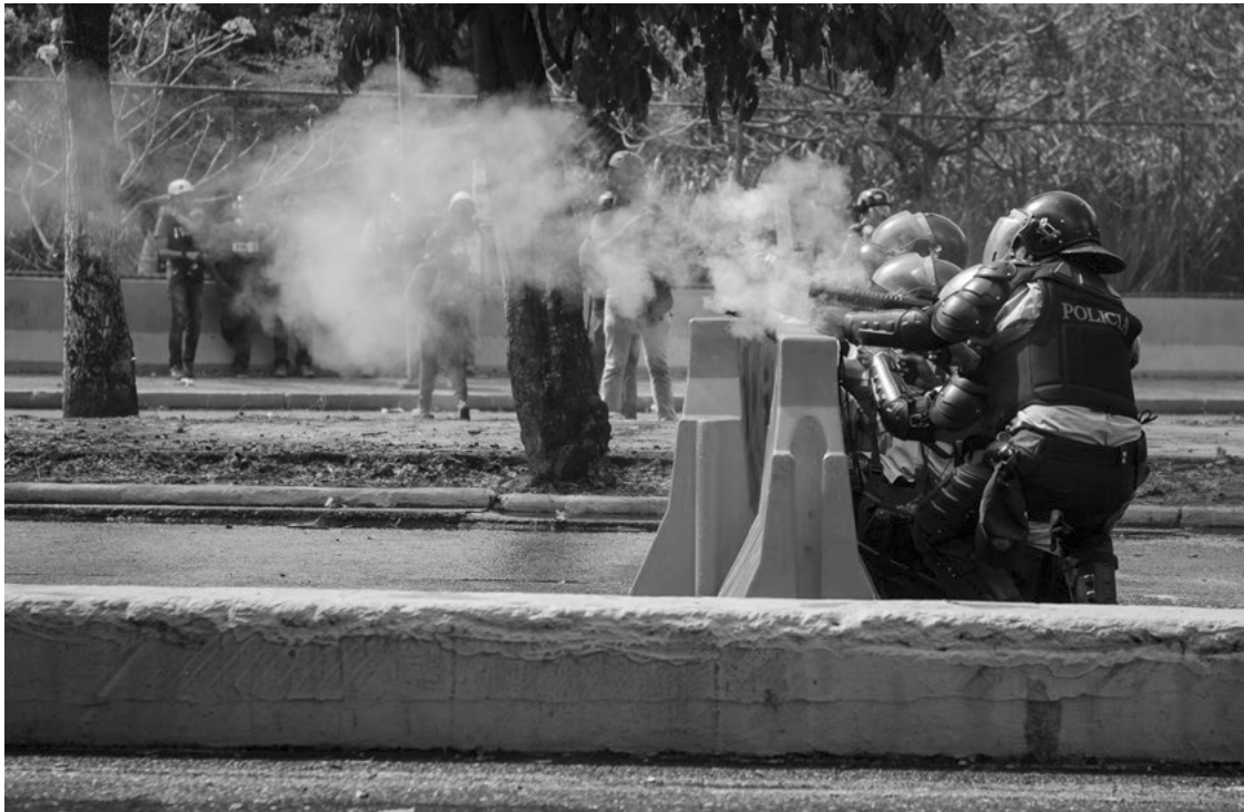
Цагдаа нар Венесуэлийн Каракас хот дахь Омбудсмэний байрны гадна жагссан оюутнуудыг тараахаар нулимс асгаруулагчаар буудаж байгаа нь, 2014 он, © Carlos Becerra

Европын Аюулгүй байдал, Хамтын ажиллагаа хариуцсан Байгууллага, Ардчилсан Засаглал, Хүний эрхийг хангах Байгууллага (АЗХЭХБ)-аас Жагсаал цуглаан хийх эрхийн хэрэгжилтэнд Хяналт тавих чухал ач холбогдолтой гарын авлагыг боловсруулжээ. 27 Энэ нь зарим талаар АЗХЭХБ-ын өөрийн гишүүн орнуудад хэрэгжүүлдэг тусгайлан хяналтын үйл ажиллагаанд зориулагдсан байх боломжтой. Гэхдээ энэ зааварчилгаа олон талаараа жагсаал цуглаанд хяналт тавьж байгаа хүний эрх хамгаалагчдад хамааралтай юм. Үүний дотроос, «Хөндлөнгийн хянагчид жагсаал цуглааны үеэр албан ёсны үзэл бодлоо хэвлэл мэдээллийнхэн болон бусад байгууллагад ямар нэг байдлаар илэрхийлэхгүй байхыг зөвлөж байна. Хүний эрхийн хараат бус хяналтыг ямар ч тайлбар хязгаарлах ёсгүй юм».