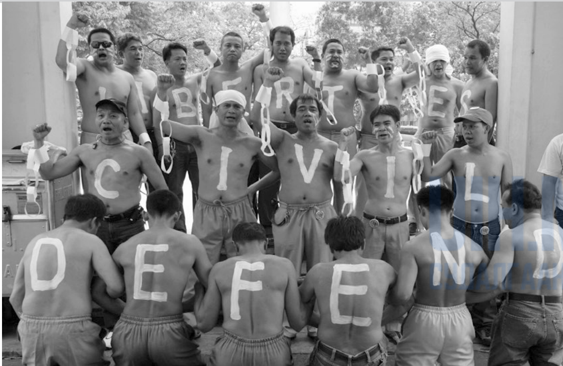
2006 оны 3 сарын 28-нд Филиппиний Нэгдсэн Эмнэлгийн гадаа эмнэлгийн ажилтнууд "Иргэний эрх чөлөөг хамгаал" гэсэн бичгийг биен дээрээ бичиж, засгийн газрын эсрэг эсэргүүцлээ илэрхийлж байгаа нь.

Үүнд мэргэжлийн болон мэргэжлийн бус хүний эрхийн ажилтнууд, сайн дурынхан, сэтгүүлч, хуульч болон тэр ч байтугай хүний эрхийг хангах, хамгаалах үйл ажиллагаанд хааяа нэг гар бие оролцдог хэн бүхэн багтаж байгаа юм.