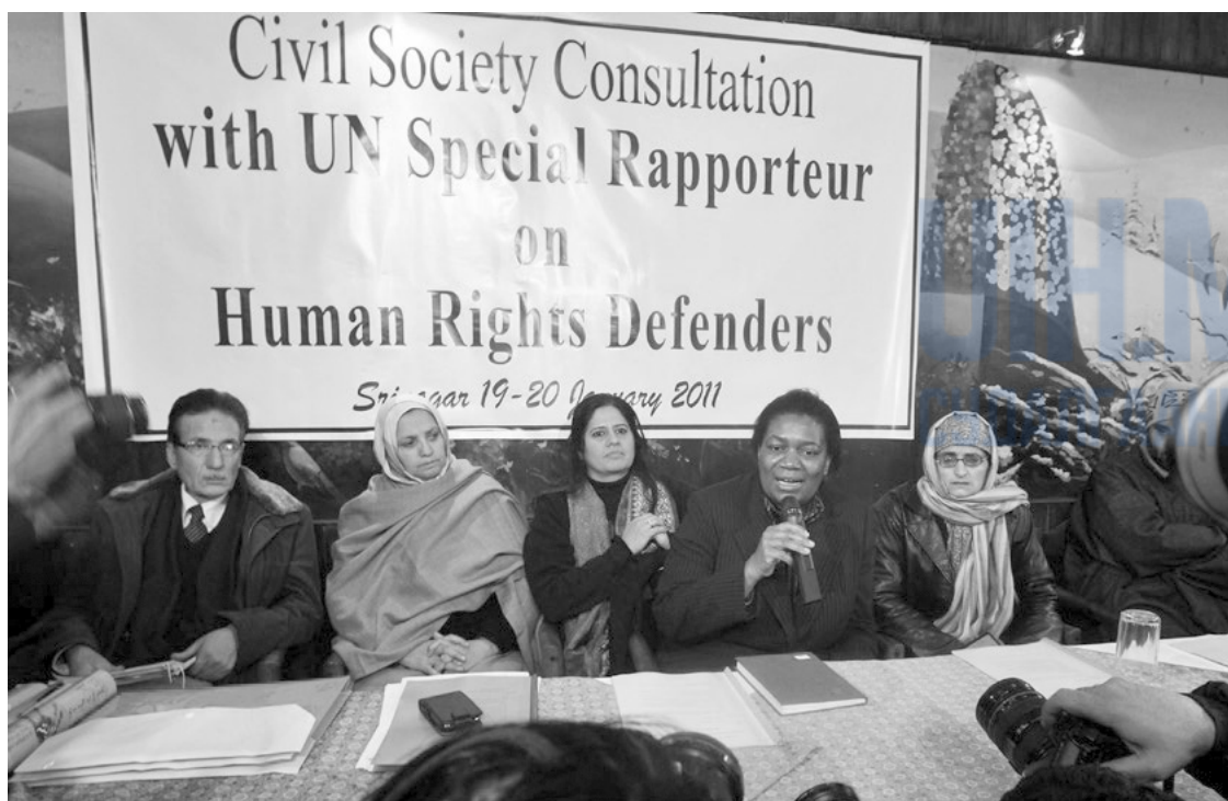
НҮБ-ын Хүний эрх хамгаалагчдын нөхцөл байдлын асуудлаарх Тусгай илтгэгч, Угандагийн иргэн Маргарет Секагая (зүүн талаас 4 дэхь нь) Энэтхэгийн Шринагар хотын иргэний нийгмийн байгууллагын гишүүдтэй уулзалт хийж байгаа нь. 2011 оны 1 сарын 19-ний өдөр.