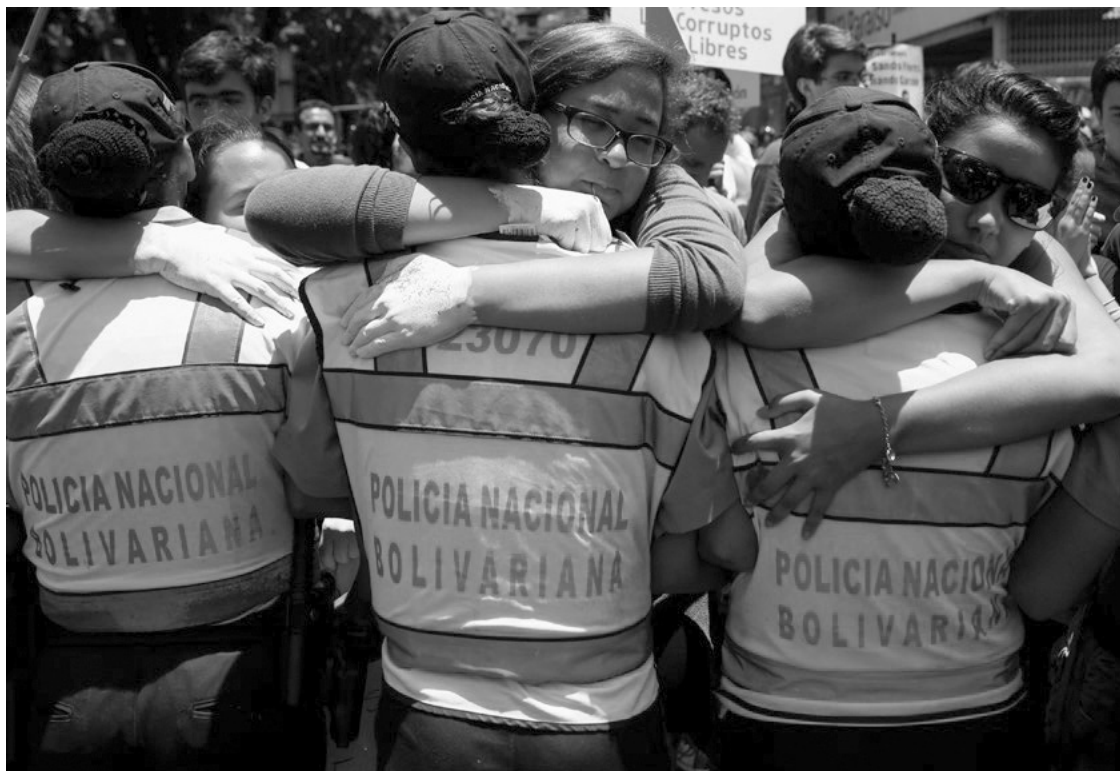
Венесуэлийн ерөнхийлөгч Николас Мадурогийн засаглалын эсэргүүцсэн жагсаалын үеэр жагсагчид хэв журам сахиулж байгаа цагдаа нарыг тэвэрч байна. 2014 оны 5 сарын 22, Каракас хот, © REUTERS/Carlos Garcia Rawlins

Гэхдээ энэ нь бүх цагдаа нар хувь хүнийхээ хувьд хүний эрх хамгаалагчдыг хамгаалах үүргээ биелүүлэхгүй байснаараа тэдний үйл хэргийн эсрэг байдаг гэсэн үг биш. Үүнд цагдаагийн албан хаагчдын мэргэжлийн ур чадварын хэр хэмжээ, цагдаагийн байгууллага ажлаа хэрхэн гүйцэтгэдэг болон хувь хүний үзэл бодол цагдааг үүргээ гүйцэтгэхэд нь хэр хэмжээнд саад учруулдаг зэргийг ойлгох нь чухал юм. Хүний эрх хамгаалагчид цагдаагийн нэг ажилтны сөрөг хандлага, үл ойшоосон байдал болон цагдаагийн байгууллагаас үүдэлтэй ерөнхий бэрхшээлийг өөр хооронд ялгаж зааглан ойлгох хэрэгтэй.