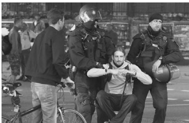
German riot police carry a protestor near Schanzenviertel ahead of the G20 summit in Hamburg (Germany), July 4, 2017.

Гэвч улс төрийн болоод эрх зүйн дарангуйлсан дэглэмтэй орнуудад жагсаал цуглааныг зөвшөөрөлгүйгээр зохион байгуулсан бол цагдаа нар жагсаалыг тараах нь ихээхэн түгээмэл байдаг. Ийм нөхцөлд жагсаалыг тараахын тулд цагдаагийн зүгээс хүч хэрэглэхээс өөр аргагүйд хүрэх, ямар төрлийн хүч хэрэглэхийг хүний эрх хамгаалагчид бодолцох хэрэгтэй.