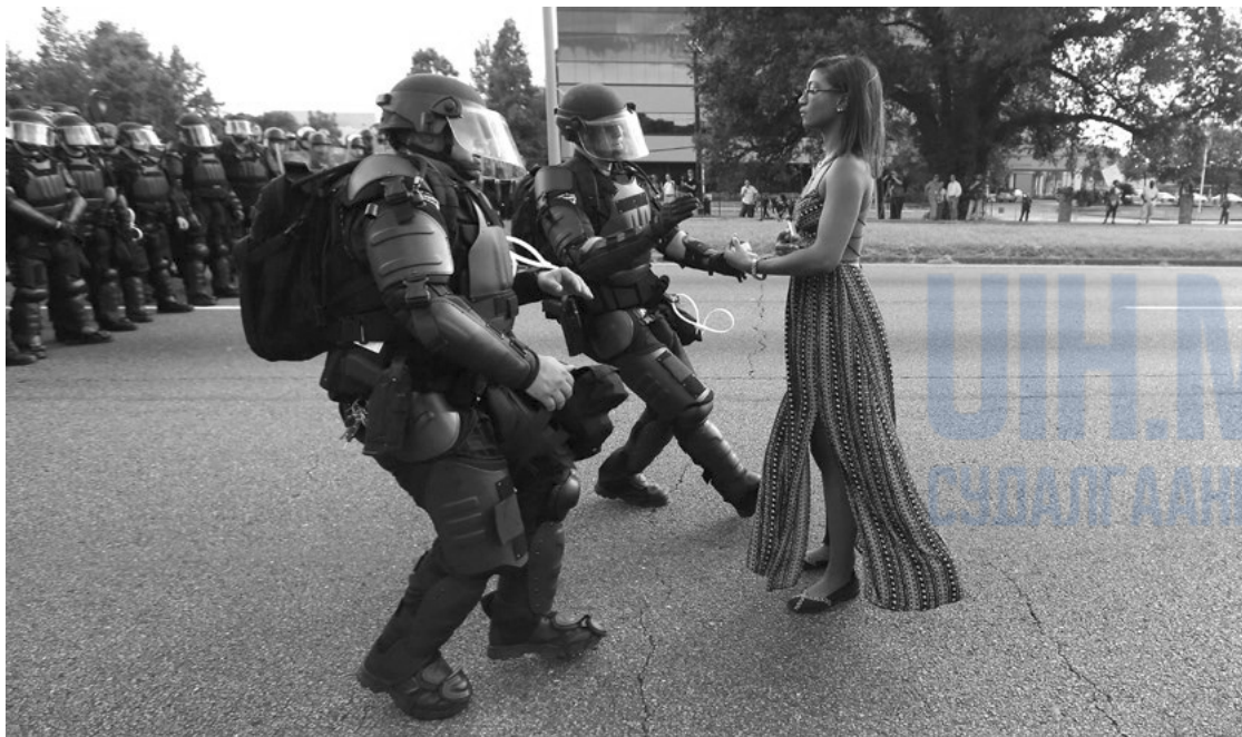
Цагдаа нар Алтон Стерлингийг буудан алсан явдлыг эсэргүүцэгчийг Батон Руж хотын цагдаагийн хэлтсийн цагдаа нар цагдаагийн газрын удирдах байрны ойролцоо баривчлан саатуулсан байна. АНУ, Луизиана муж, Батон Руж, 2016 оны 7 сарын 16

Цагдаа нар хүний эрх зөрчсөний дараа хүний эрх хамгаалагчид ихэнх тохиолдолд болсон явдлын талаар олон нийтэд хандан шүүмжилсэн мэдэгдэл гаргахыг хүсдэг. Гэхдээ, цагдаагийн үйл ажиллагаанд нөлөөлөхийн тулд иймэрхүү мэдэгдлийг олон нийт төдийгүй цагдаагийн зүгээс хэрхэн хүлээж авахыг бодолцох хэрэгтэй. Ялангуяа, шүүмжилж байгаа арга зам нь, цагдаагийн зүгээс жагсаал цуглааныг хэрхэн зохицуулах талаар нээлттэй хэлэлцүүлэгт оролцох эсэх болон шүүмжлэл, санал болгосон зөвлөмжүүдийг нухацтай хүлээн авах эсэхэд ихээхэн нөлөө үзүүлнэ.