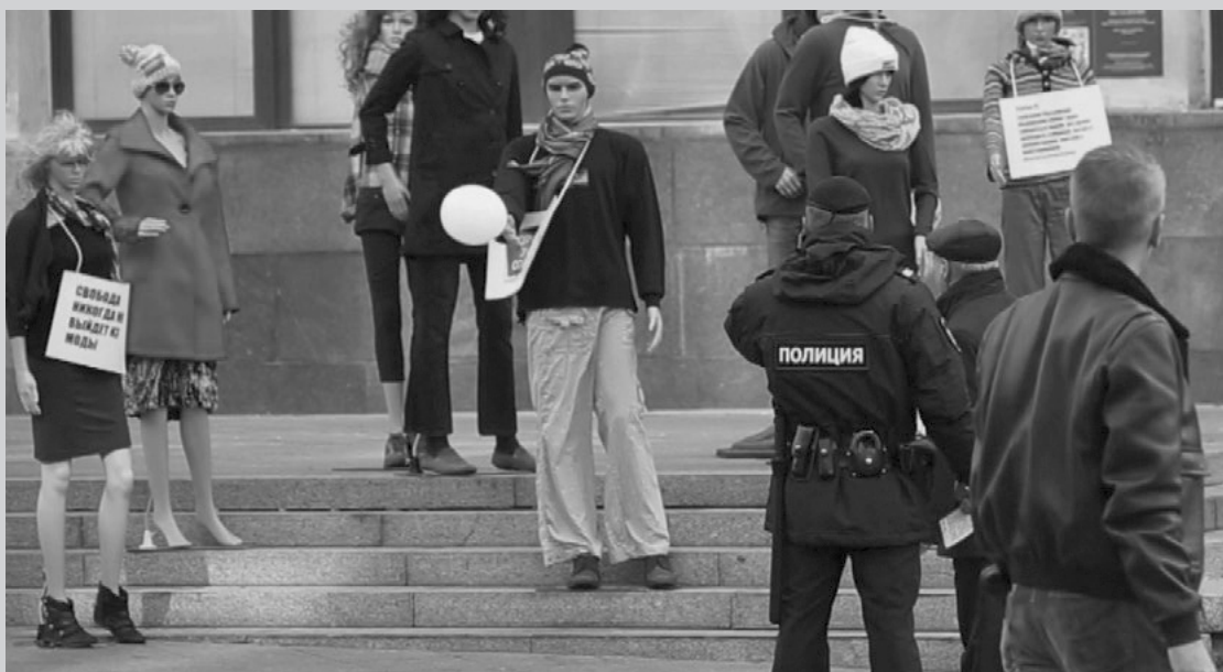
Эмнести Интернэшнлийн “Ухаалаг бай”: - Оросын Үзэл бодлоо илэрхийлэх эрх чөлөө, хувцасны манекан ашигласан эсэргүүцлийн жагсаалыг харуулсан киноноос авсан зураг. 2015 он.

2014 онд ганц хүний эсэргүүцлийн жагсаалыг ОХУ-ын засгийн газрын холбогдох байгууллагаас зөвшөөрөл авахгүйгээр Эмнести Интернэшнл зохион байгуулахдаа хувцас өмсгөдөг манеканыг үхүүлэх хуудас бариулан ашигласан. 17