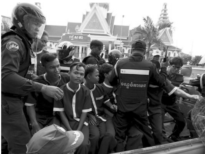
“Цагдаа саатуулагдсан үедээ хэрхэх талаарх эрхээ мэд” Үндэсний Хүний Эрхийн Нийгэмлэг (Хакам)-ийн гарын авлага, 2016 он, дэлгэцийн зургийг 2018 оны 5 сард авав.

«Эсэргүүцлийн цуглааны үеэр цагдаагийн хүчирхийллийг баримтжуулах тухай удирдамж»-ийн 19 дүгээр зүйл нь Бразил улсад жагсаал цуглааны үеэр хүний эрх хамгаалагчдын цагдаагийн үйл ажиллагааны талаар бичлэг хийхдээ хэрэглэдэг зааварчилгаа болдог. Бичлэгийг хэрхэн хийвэл илүү үр нөлөөтэй болох, түүнчлэн хууль тогтоомжийн дагуу хийж болох үйлдэл, түүнчлэн хуулийн хэрхэн ойлгож хэрэглэх талаарх асуулт, зөвлөмжүүдийг энэхүү зөвлөмжид тусгасан байдаг. Түүнчлэн, хэрэв цагдаа хууль бус шийдвэрээ тулгавал ямар арга хэмжээ авах талаар зөвлөсөн байдаг. Жишээлбэл, бичлэгээ зогсоох, эсвэл устгахыг шаардсан тохиолдолд цагдаагийн ажилтанд уг бичлэг цацагдаж байгаа, мөн хууль бус үйл ажиллагаанаас сэргийлэхэд тустай болохыг хэлэх хэрэгтэй гэж зааварчилгаанд зөвлөжээ. 11