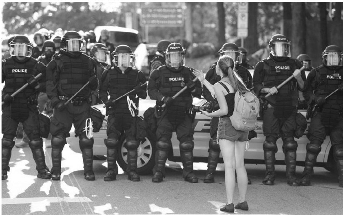
Арьс өнгөөр алагчлах үзлийг дэмжигчдийн зохион байгуулсан цуглааныг нийгмийн сүлжээгээр тараасан мэдээлэл гарсны дараа болсон цуглааны үеэр жагсаалыг эсэргүүцэгч цагдаа нартай ярилцаж байгаа нь, Хойд Каролина Дурам хот, АНУ, 2017 оны 8 сарын 18, © REUTERS/Jason Miczek

шууд буудаж болохгүй. 26 Хэрэв эдгээр журмыг цагдаа нар баримтлаагүй тохиолдолд хүний эрх хамгаалагчид цагдаагийн хөндлөнгийн оролцоог зохих байдлаар шүүмжилж байр сууриа илэрхийлэх боломжтой. Маш олон тохиолдолд хүний эрх хамгаалагчид өөрийн үзсэн харсан, ажигласан зүйлсээ олон нийттэй хуваалцахаар өөрийн эрхгүй сэтгэл хөдлөлдөө автах нь элбэг тохиолддог. Олон нийтийг хамарсан жагсаал цуглааныг ажиглаж байгаа хүний эрх хамгаалагчид ийм байдалд орох нь амархан.