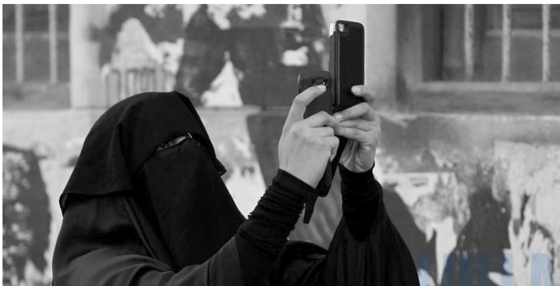
Жагсаалд оролцогч Манамад болсон засгийн газрыг эсэргүүцсэн жагсаалын бичлэгийг хийж байгаа нь, Бахрайн. 2012 оны 12 сарын 17.

Олон нийтийг хамарсан жагсаал цуглааныг зохицуулахтай холбоотой хүний эрхийн олон улсын эрх зүйн зохицуулалт бодлогын баримт бичгийг танин мэдэж, зөв хэрэглэх чадвартай байх нь цагдаагийн үйл ажиллагааг үнэлэхэд чухал ач холбогддолтойн зэрэгцээ шаардлагатай тохиолдолд тэдний дэмжлэгийг авахад тусална. Тухайлбал, хэрэв хууль сахиулагчид тухайн жагсаал цуглааныг хууль бус гэж үзэж байгаа бол тухайн асуудлыг харилцаанд тулгуурлан хэрхэн шийдвэрлэх арга замыг эрэлхийлэх, мөргөлдөөн гарсан үед тайвнаар зохицуулж, хүрээ хязгаарыг хумих шаардлагатай байдаг. Ийнхүү ажиллахдаа тэд жагсаал цуглааны үед хууль зөрчиж хүч хэрэглэсэн үйлдэлд оролцсон иргэдийг өөрсдийн тайвнаар жагсах эрхээ эдэлж буй жагсагчдаас ялгаж зааглах шаардлагатай байдаг. Жагсаал цуглааныг улс төрийн болоод бусад төрлийн хурцадмал байдалд шилжихээс урьдчилан сэргийлж дэлхий даяар хууль сахиулах байгууллагууд олон тооны арга зүй, хэрэглэгдэхүүн боловсруулсан байдаг. 7 Жагсаал цуглааныг зохион байгуулах, ажиглах үед хүний эрх хамгаалагчдад хүний эрхийн олон улсын эрх зүй болон хэм хэмжээний дагуу цагдаа нар үүргээ хэрхэн биелүүлж байгаад дүн шинжилгээ хийх, мөн тэдэнтэй тулгарсан бэрхшээлийн талаар (мөн боломжит шийдлийг олохоор) зөвлөлдөхөд эдгээр жишээ тус болно.