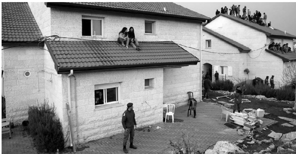
Израйлийн цэргүүд Палестиний баруун эргийн Офра тосгоны иргэдийг албадан нүүлгэх ажиллагааны үеэр оршин суух эрхийн төлөө тэмцэгчид байшингийн дээвэр дээр гарч эсэргүүцлээ илэрхийлж байгаа нь, 2017 оны 2 сарын 28, © REUTERS/Ronen Zvulun

Хуулинд заасан “хууль сахиулагчид ... болно” гэдэг тодорхойлолт нь “хууль сахиулагчид ... ёстой” гэдэг тодорхойлолтоос илүү олон хэрэглэгддэг. Энэхүү “болно” гэдэг утга нь хуулиар олгосон боломжуудаас хэрхэн сонголт хийж байгаа талаар цагдаа нартай ярилцах, хүний эрхийн хандлагаар шийдвэр гаргах үйл явцыг цагдаа нарт санал болгох боломжийг олгож байгаа юм. Жишээ нь, дотоодын хууль тогтоомжийн дагуу хууль бус гэж үзсэн жагсаал цуглааны хувьд хуулиар тараах ёстой гэж заасан байсан ч заавал тийнхүү тараах шаардлагагүй. Цагдаа хууль, дэг журам сахиулах үндсэн үүрэгтэй тул хүний эрх хамгаалагчид, хуулиар зөвшөөрөөгүй боловч тайван цуглааныг тараах нь дэг журам сахиулах бус сөрөг үр дагавартай болохыг цагдаа нарт тайлбарлан ойлгуулж болно. Цагдаагийн зүгээс дэг журам сахиулах бус эмх замбараагүй байдал үүсгэж мэдэх тул тайван цуглааныг тараахаас татгалзах хэрэгтэй. Энэ бол орчин цагт хүлээн зөвшөөрөгдсөн хэм хэмжээ бөгөөд жагсаал цуглааныг зохицуулах сайн туршлагад тооцогддог юм. 28