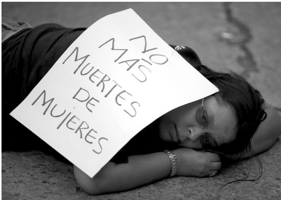
Олон улсын Олимпын Хорооны 119-р чуулган Гватемала хотод болох үеэр Гватемалд эмэгтэйчүүдийн амийг хөнөөх явдал их байгаад олны анхаарлыг хандуулахыг хүссэн тэмцэгч эсэргүүцлээ илэрхийлж байгаа нь, 2007 оны 7 сарын 3. Эсэргүүцлийн хуудсан дээр “Эмэгтэйчүүдийг хөнөөхөө зогсоо” гэсэн байна.