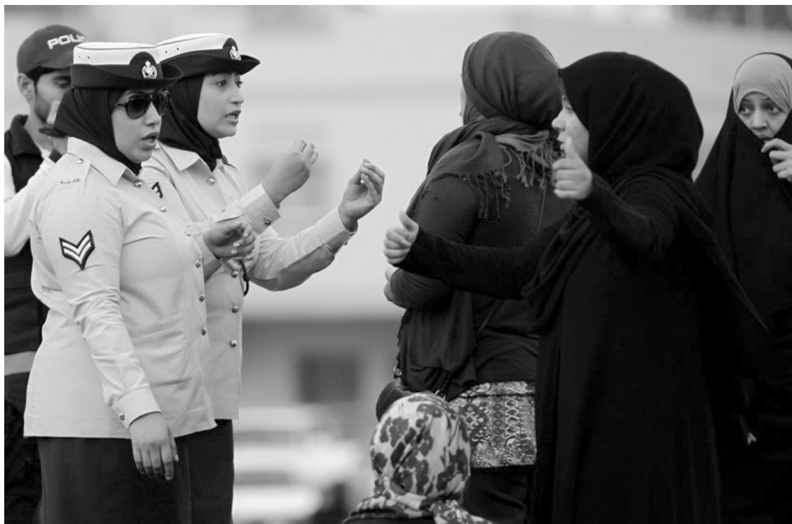
Олон нийтийн цагдаа нар засгийн газрыг эсэргүүцэгчдийг баруун Манам дахь Будаяагийн хурдны гол зам дээрх тойрог замыг чөлөөлөхийг шаардаж байгаа нь, 2012 оны 3 сарын 26.

Эрхэлж байгаа албан тушаалаасаа хамааран хууль сахиулагчдын гүйцэтгэх чиг үүрэг харилцан адилгүй болохыг танин мэдэх нь ихээхэн чухал юм. Хүний эрх хамгаалагчид үйл ажиллагаагаа хуулийн дагуу явуулж байгаа нөхцөлд цагдаагийн зүгээс тэдний эсрэг ямар нэгэн арга хэмжээ авах, үйл ажиллагаанд нь саад учруулах шалтгаан байхгүй. Иймээс хүний эрх хамгаалагчид үйл ажиллагаагаа явуулахдаа дотоодын хууль тогтоомжийг аль болохоор зөрчихгүй байх сонирхолтой. Энэ нь тэдний ажилд шууд болон шууд бусаар нөлөө үзүүлдэг хууль тогтоомжуудын тухай, мөн цагдаагийн үйл ажиллагааг зохицуулдаг эрх зүйн цар хүрээг сайн мэддэг байхыг шаардаж байгаа юм.