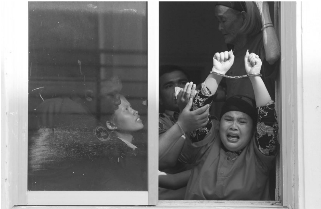
Орон байртай байх эрхийн төлөө тэмцэгчид Пном Пений давж заалдах шатны шүүх рүү очих замдаа цонхоор хашгирч байгаа нь, Камбож, 2015 оны 1 сарын 26.

1990-ээд оны сүүлээр Сербийн Оптор! залуучуудын хөдөлгөөний дэмжигчид тухайн үеийн ерөнхийлөгч Слободан Милошевичийг эсэргүүцсэн үйл ажиллагааныхаа үеэр олон удаа цагдаад баривчлагдаж байжээ. Гишүүдээ тэмцэлдээ идэвхитэй оролцуулах, баривчилгааны сөрөг үр дагаврыг бууруулахын тулд Оптор! «В төлөвлөгөө» хэмээх тактикийг боловсруулсан нь эхний баривчилгаа явагдсаны дараа дараагийн эсэргүүцэгчдийг цагдаагийн газрын гадна талд бэлэн байлгах явдал байв. Үндсэн эсэргүүцлийн жагсаалд оролцогчид баривчлагдана гэсэн бодолтой, баривчлагдахад бэлтгэгдсэн байдаг байв. Өмнө нь баривчлагдаж байсан хүмүүсийн туршлагад үндэслэн цагдаагийн асуудаг асуултуудын жагсаалт болон боломжит хариултыг гаргах зэргээр цагдаагийн байцаалтанд бэлтгэдэг байжээ. Хоёрдахь эсэргүүцлийг мөн урьдчилан төлөвлөж, хичнээн тэмцэгчид үндсэн эсэргүүцлийн ажиллагаанд оролцохгүй ард нь үлдэх болон хуульчид, хэвлэл мэдээллийнхэн, сөрөг хүчнийхнийг уриалахад бэлэн байхаар төлөвлөдөг байв. Хуульчид нэмэлт баривчилгаа явагдахаас урьдчилан сэргийлэхийн тулд цагдаагийн газарт хамгийн түүрүүнд ирэх ёстой. Тэд мөн цагдаагийн газрын гадна талд бусад жагсагчид болсон явдлын талаар мэдээлэл хийж байх хооронд баривчлагдсан идэвхитнүүдийг суллах талаар цагдаа нартай ярилцах ёстой байв. 20