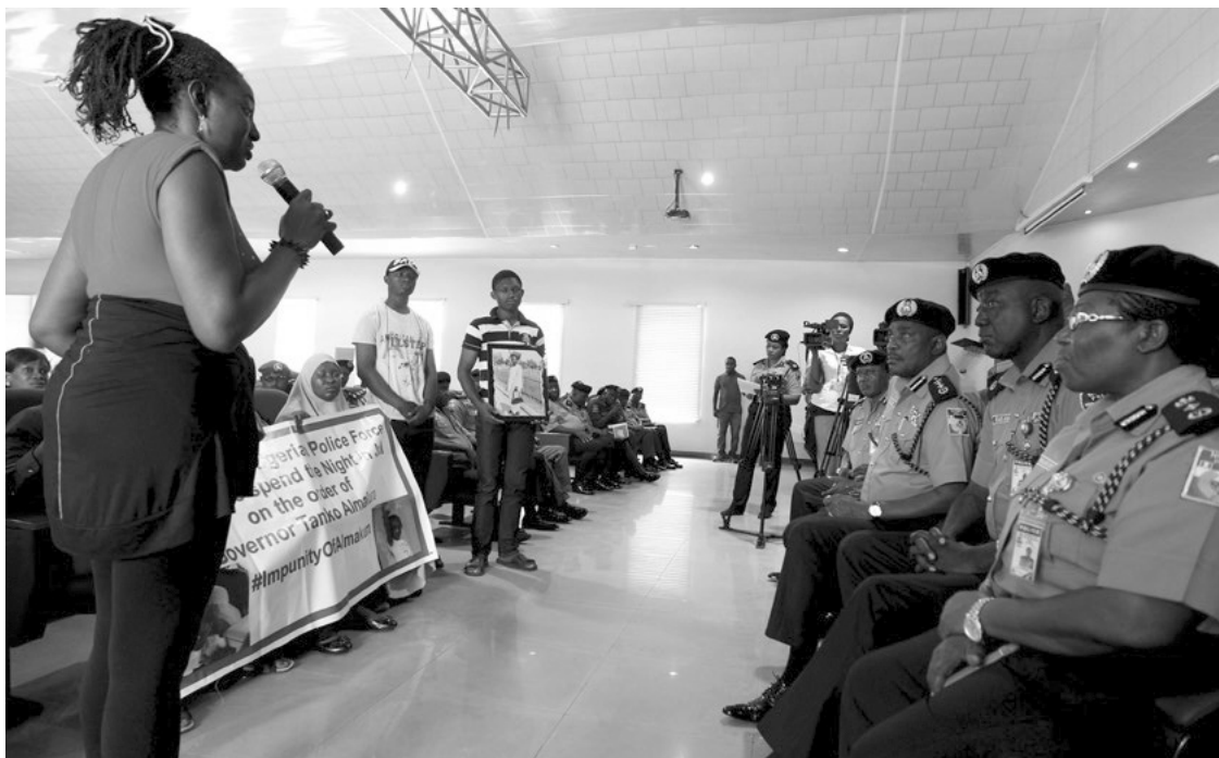
Хүчирхийллийн эсрэг иргэний хөдөлгөөнийхөн Нигерийн цагдаагийн газрын ерөнхий мөрдөн байцаагч Соломон Арасыг цагдаагийнхны 2015 оны 8 сарын 18-нд хэт их хүч хэрэглэсэн хэргийг шалгуулахаар шаардаж байгаа бөгөөд уг хөдөлгөөний гишүүн цагдаагийн үйлдсэн аллагуудын тухай ярьж байна.

Цагдаагийн байгууллагын дотор зохих түвшиндээ очиж харьцах нь ихэнхдээ амаргүй байдаг. Дээд албан тушаалын хүнтэй уулзахаар очсон хүний эрх хамгаалагчдыг тухайн асуудлаар шийдвэр гаргаж чадах хүнтэй уулзуулахын оронд заримдаа хэвлэл мэдээллийн, эсвэл олон нийттэй харилцах ажилтан, хүний эрхийн хэлтэс юмуу, сургалтын хэлтсийн ажилтнуудтай уулзуулах нь олонтаа тохиолддог. Эдгээр ажилтнуудаас мэдээлэл авах нь хамгаалагчдын ажилд хэрэгтэй боловч тэд бол тухайн тодорхой асуудлын талаар шийдвэр гаргах аливаа эрхгүй. Цагдаагийн үйл ажиллагаа хэрхэн явагдах талаарх бодлого, зааварыг зөвхөн дээд түвшний нэгжүүд тодорхойлдог ба эрх хэмжээний хувьд сургалтын байгууллага нь тэдгээр заавар журмыг зөвхөн хүлээн авагч бөгөөд дэг журам сахиулах, зааварчилах тухайд ямар нэгэн шийдвэр гаргах эрх мэдэлгүй байдаг.