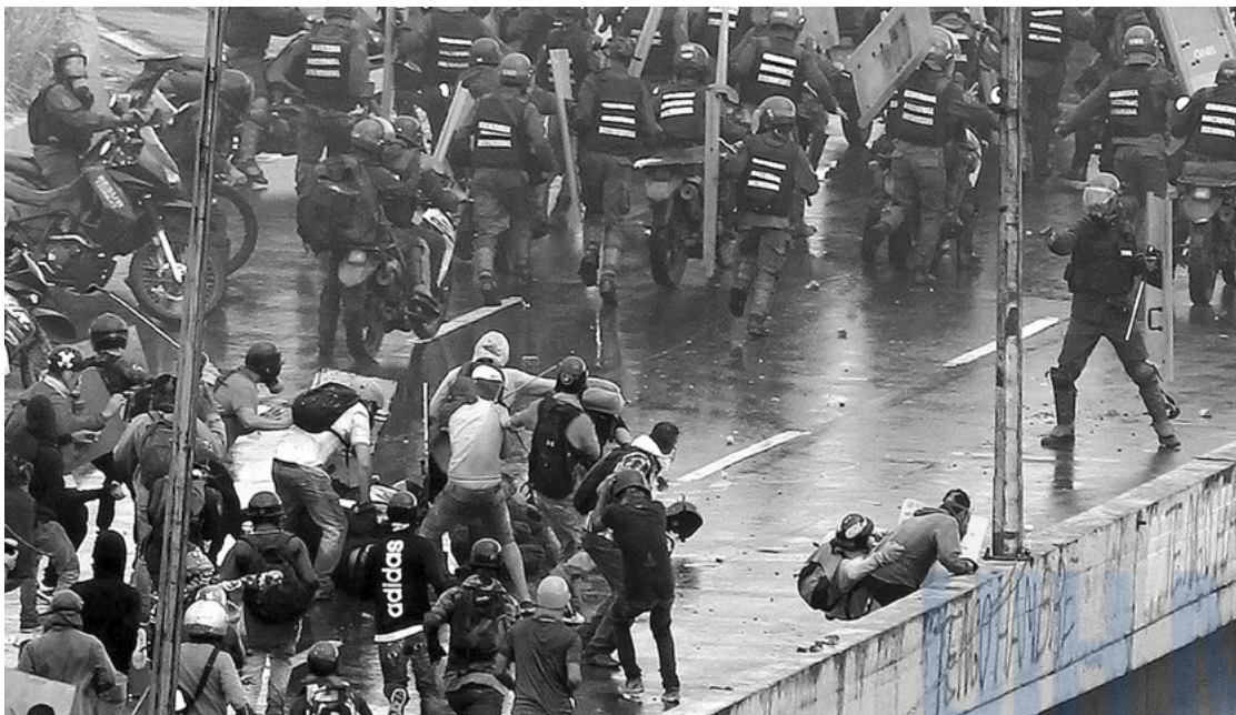
Венесуэлийн Каракас хотод болсон Ерөнхийлөгч Николас Мадурогийн засаг захиргааг эсэргүүцсэн жагсаалын үеэр жагсагчид руу аюулаас хамгаалах хүчнийхэн (баруун гар талд) буутай ижил зүйл чиглүүлсэн байгаа нь, 2017 оны 6 сарын 17

Иймээс хүний эрх хамгаалагчид цагдаагийн тэдэнд учруулж болзошгүй эрсдэлийн талаар ойлголттой байж, тэрхүү эрсдэлийг бууруулах, хамгаалах төлөвлөгөө боловсруулах нь чухал. Энэ хэсэгт бид дээрх асуудлын тухайд анхаарвал зохих зүйлсийн талаар тоймлон авч үзэх болно. Өмнө нь өгүүлсэнчлэн, энэхүү гарын авлага хүний эрх хамгаалагчдад зориулсан аюулгүй ажиллагааны зөвлөмж биш билээ.