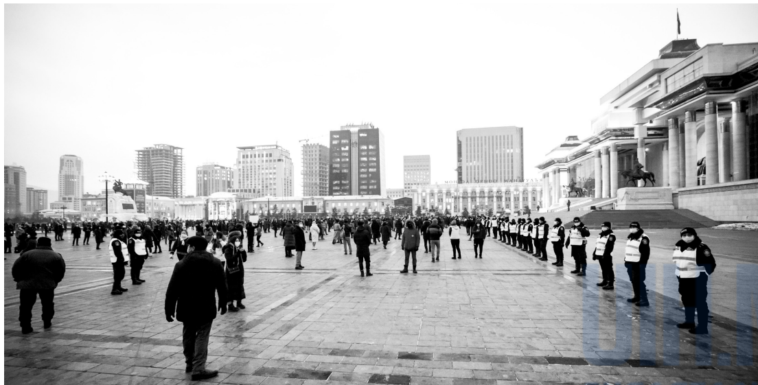
2021 оны 1 дүгээр сарын 20. Д.Сүхбаатарын талбайд иргэд сайн дураараа нэгдэн Улсын Онцгой комиссыг огцрохыг шаардлаа

2021 оны 1 дүгээр сарын 13-ны өдөр Баянгол дүүрэгт жижиглэнгийн худалдаа эрхлэгчдийн зарим төлөөлөл Төрийн ордны баруун хойд хаалганы гадна Ерөнхий сайд болон Шадар сайдад шаардлага хүргүүлэхээр цуглажээ. Уг цуглааныг зохион байгуулсан үндэслэлээр иргэн С.М-г цагдаагийн байгууллагаас 1 хоног албадан саатуулжээ. 2021 оны 1 дүгээр сарын 27-ны өдөр Сүхбаатар дүүргийн Эрүүгийн хэргийн шүүхээс С.М-д Зөрчлийн тухай хуулийн 5.8, 5.13 дахь заалтыг зөрчсөн үндэслэлээр 7 хоног баривчлах шийтгэл ногдуулжээ. 14