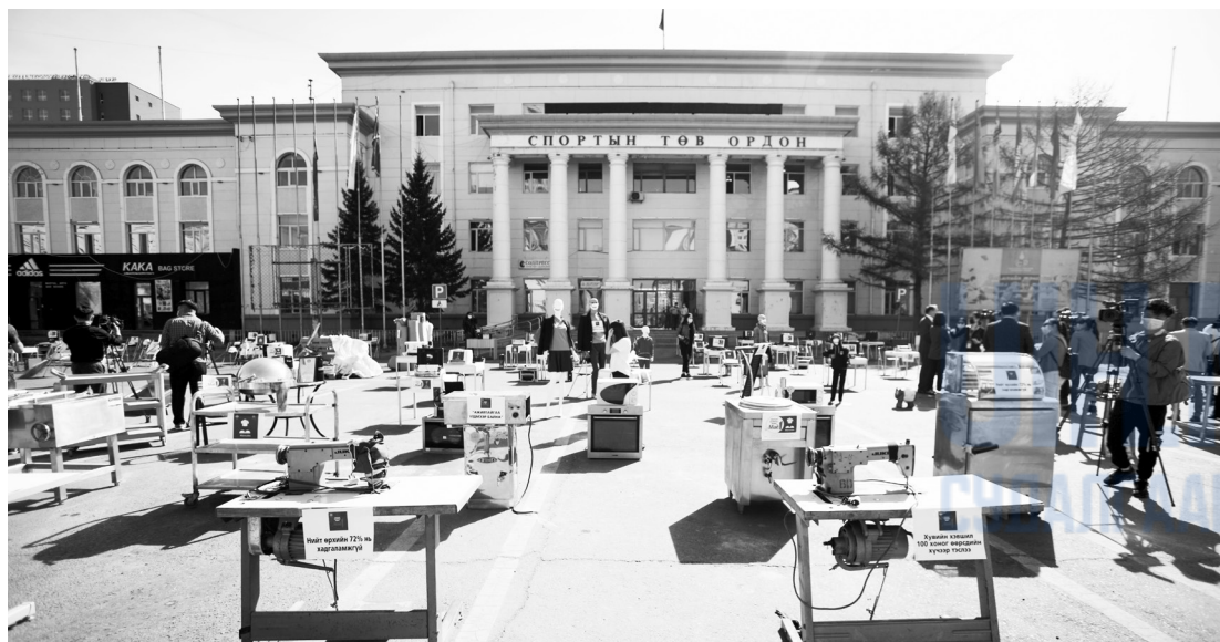
2020 оны 5 дугаар сарын 1. МҮХАҮТ-аас зохион байгуулсан “Ажлын байраа хамгаалъя” цахим жагсаал

Чингэлтэй дүүргийн Засаг даргын Тамгын газар Нийслэлийн Соёл урлагийн газраас ирүүлсэн Тусгаар тогтнолын талбайд “Миний Улаанбаатар бүжгийн чалленж” түүний зураг авалт хийх тухай мэдэгдлийг 2020 оны 8 дугаар сарын 7-ны өдөр бүртгэжээ. Мөн нийслэлийн Засаг даргын хэрэгжүүлэгч агентлаг Шинжлэх ухаан үйлдвэрлэл инновацийн газраас ирүүлсэн Явуухулангийн цэцэрлэгт хүрээлэнд “Creative fall festival” урлагийн наадам зохион байгуулах мэдэгдлийг 2020 оны 9 дүгээр сарын 24-нд бүртгэн авчээ. Дээрх арга хэмжээнд 44 урлан, уран бүтээлч, 800 гаруй хүн оролцсон хэмээн тус арга хэмжээг зохион байгуулагч Geru компани мэдээлжээ. 21