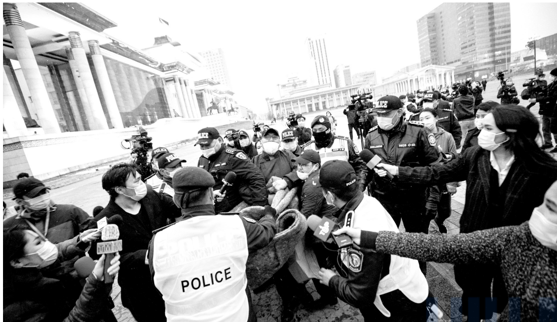
2021 оны 5 дугаар сарын 5. Ардчилсан намаас Д.Сүхбаатарын талбай дээр өлсгөлөн зарлажээ.

Хүний эрхийн олон улсын хэм хэмжээний дагуу цагдаагийн байгууллага тайван журмаар явагдаж байгаа жагсаал, цуглааныг зохих байгууллагад мэдэгдэл хүргүүлээгүй, бүртгүүлээгүй гэх зэргээр хууль зөрчсөн үндэслэлээр хүч хэрэглэн тараахаас зайлсхийж, тайван жагсаал, цуглаанд оролцогчдын зарим үйлдлийг хүлцэн тэвчих үүрэгтэй.