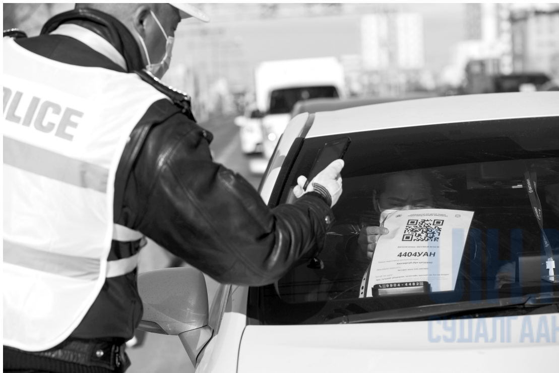
2021 оны 4 дүгээр сарын 27. Гамшгаас хамгаалах бүх нийтийн бэлэн байдлын зэрэгт шилжсэн үе.

Улсын Онцгой Комиссын шийдвэрээр 2020 оны 2 дугаар сарын 23-27-ны өдрүүд буюу цагаан сарын өдрүүдээр хот хоорондын зорчих хөдөлгөөнийг түр хязгаарлаж автобус, галт тэрэг, автомашинаар зорчих хөдөлгөөнийг түр хязгаарласан. Үүнээс хойш 2021 оны 6 дугаар сарыг дуустал хугацаанд өндөржүүлсэн бэлэн байдалд шилжүүлсэн шийдвэрийг 17 удаа сунгасан бол бүх нийтийн бэлэн байдлын зэрэгт 5 удаа шилжүүлж, 2 удаа сунгажээ.